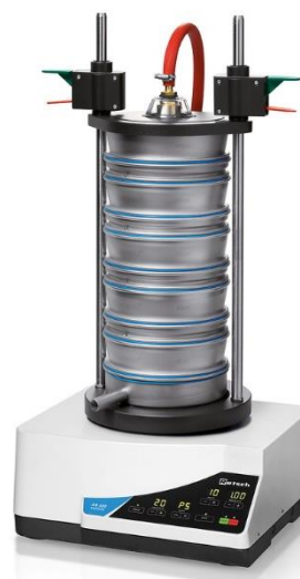
Automatické osievacie zariadenie